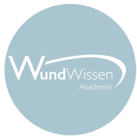
Wundwissen - Die Wundex Akademie