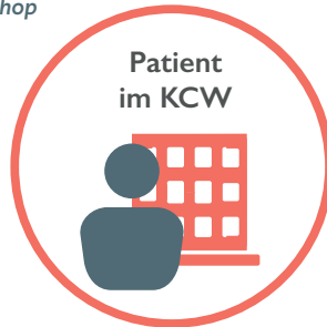
Patient im KCW